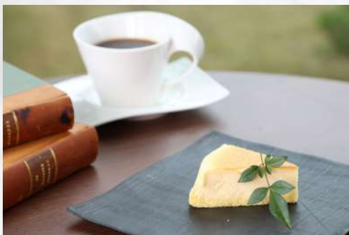
スフレフロマージュ