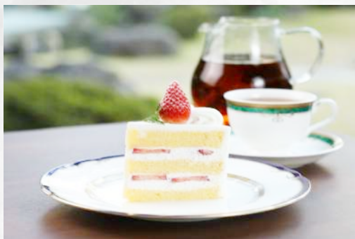
ガトー・フリーズ