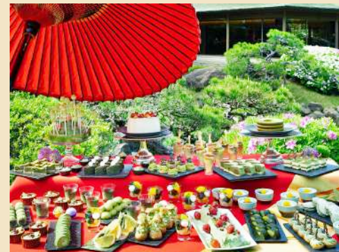
季節変わりのホテルスイーツビュッフェ