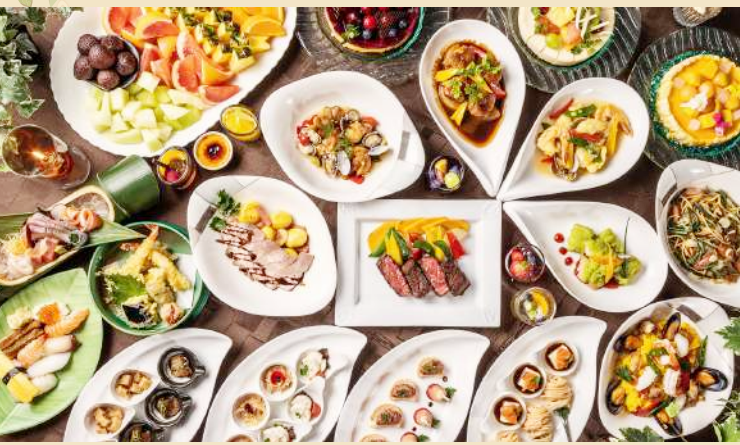
四季食材の和洋料理

shizuku のビュッフェはお食事はもちろん、 フェア料理やデザートまで存分にお楽しみいただけます。