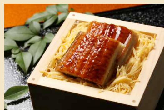
季節変わりのフェア料理

料理内容は季節やフェア内容によって変更します。常に上記画像の料理をご提供しているわけではございませんのでご注意ください