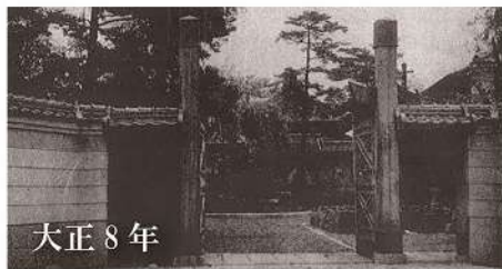
大正 8 年

明治 22 年、当時の炭鉱主の自宅として新築。大正 4 年には小倉の実業家の手に渡り「豊山閣」と命名され、茶会や句会に利用されました。昭和 24 年頃に旅館となり、同 26 年「旅館田川」が誕生。同 48 年に「ホテルニュー田川」と改名され、増改築が行われてきました。令和となり、全国約 140 ホテルを運営するマイステイズ・ホテル・マネジメントが引き継ぎ、「アートホテル小倉ニュータガワ」と改名し、現在に至ります。