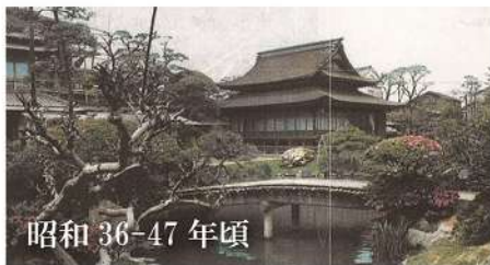
昭和 36-47 年頃