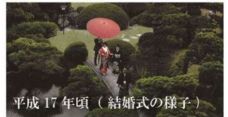
平成 17 年頃（結婚式の様子）